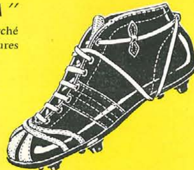
BRASIL S. L.

Modèle "PUMA" — V. Box noir, bout avec bandes déposées, laçage breveté, Crampons vissés licence "PUMA"